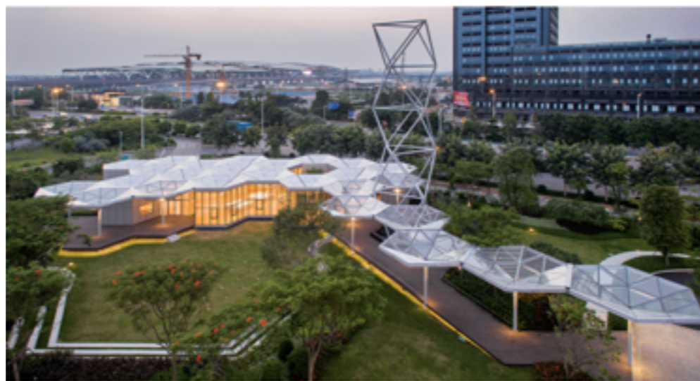
08 | 广州新城 | CPDT Architecture