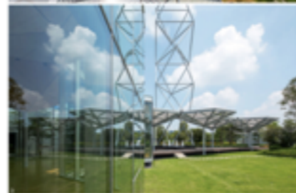
09 | 广州新城 | CPDT Architecture