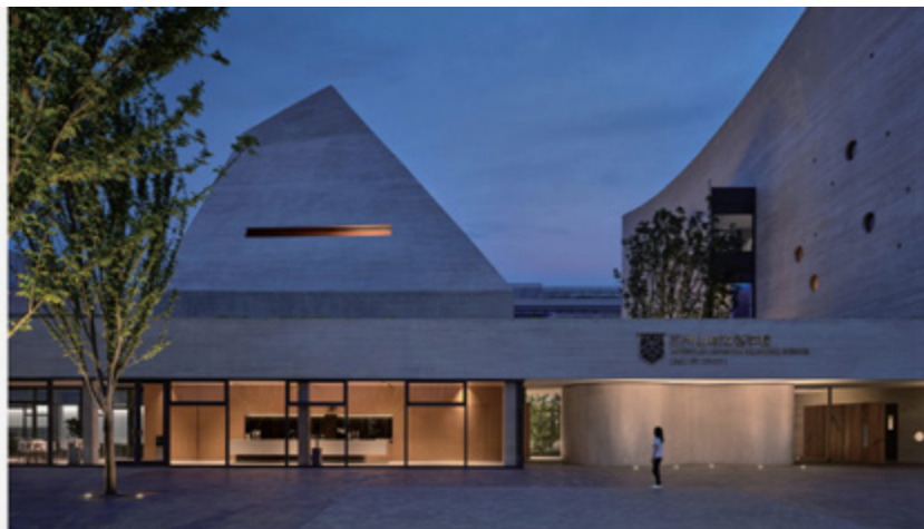
1 主入口、主图书馆、主图书馆