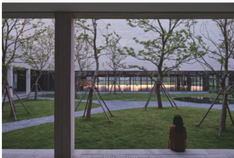
1 庭院 - 杭州山南文化综合体