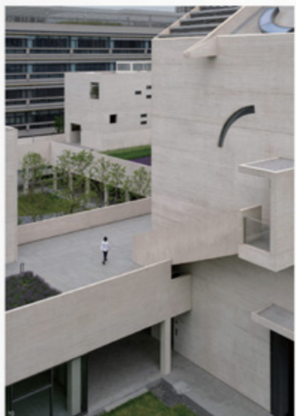
10 从居住区南侧看新图书馆和图书馆 11 建筑