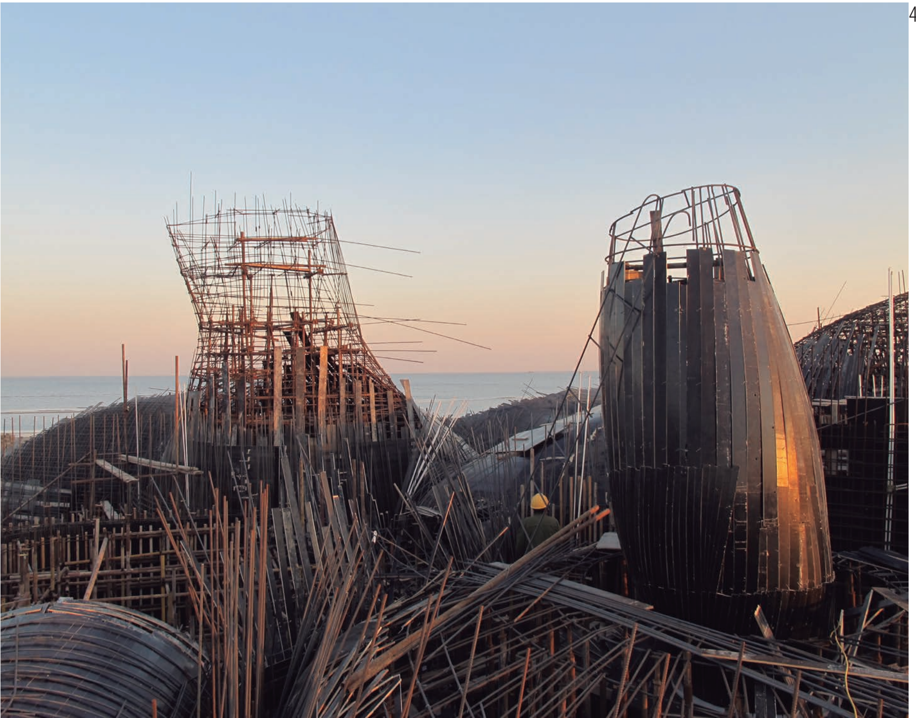
Detalle de los encofrados / Formwork Detail &gt;