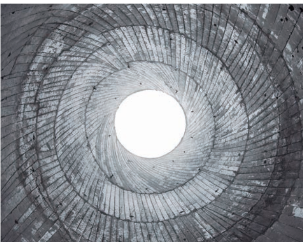
Espacios Interiores / Interior Spaces &gt;